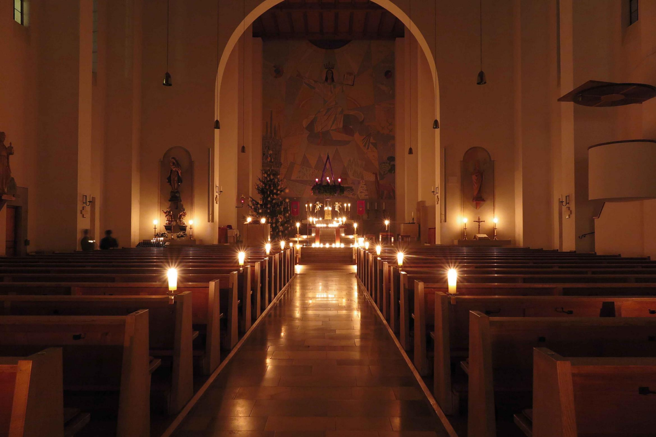
in der Adventszeit werden die wöchentlichen Roratemesen frühmorgens bei Kerzenschein gefeiert