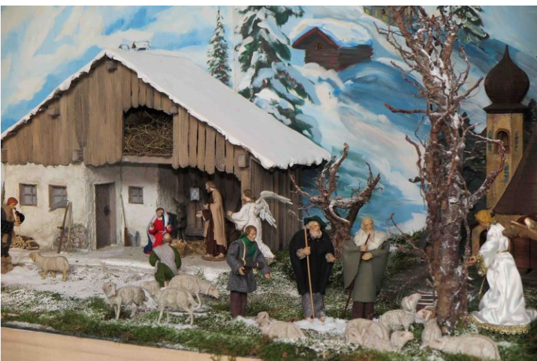
ein Engel verkündet den Hirten die frohe Botschaft...