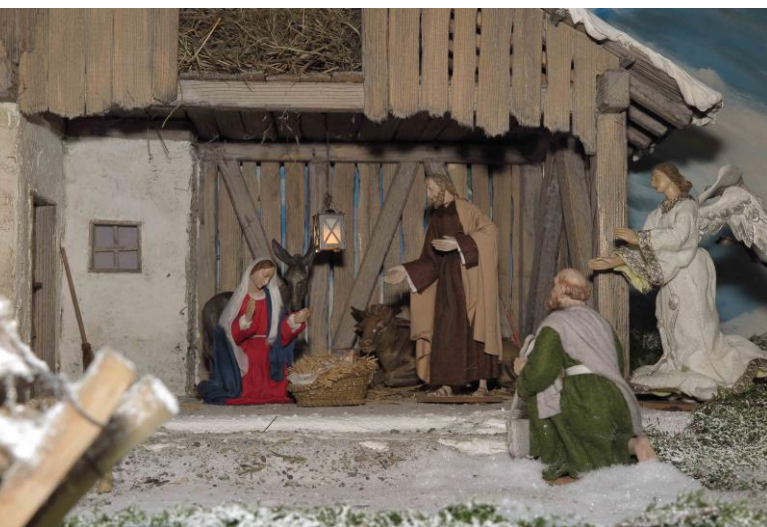
das Jesuskind anzubeten