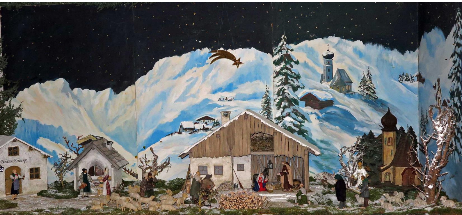
Gesamtansicht unserer Weihnachtskrippe