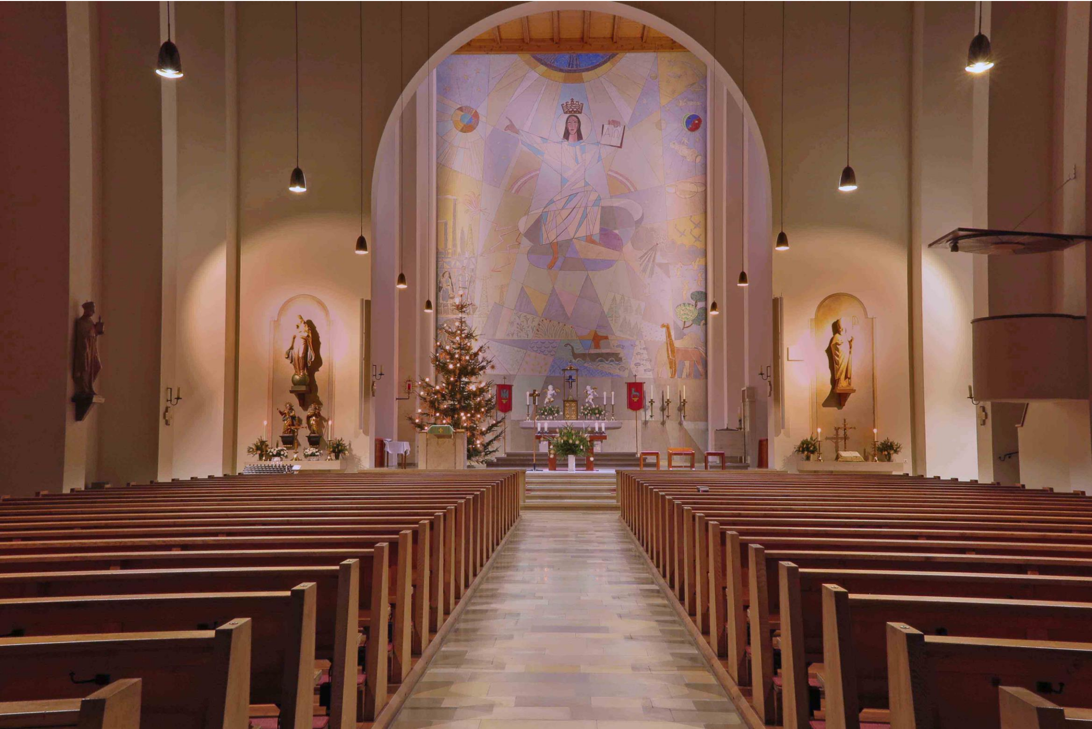
der weihnachtlich geschmückte Kirchenraum von St. Ulrich