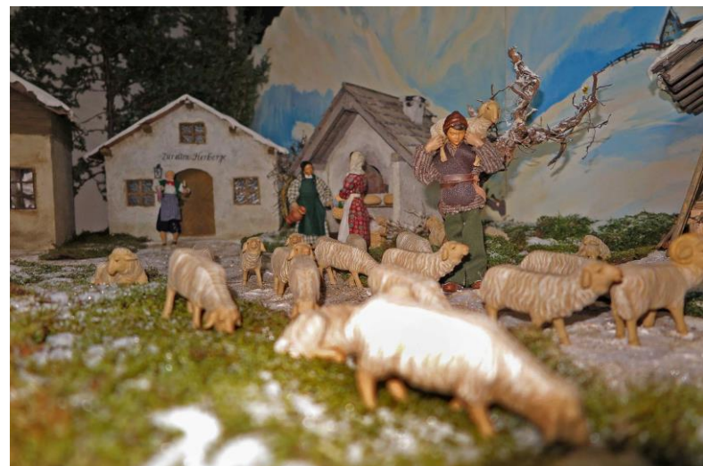
sie eilen zur Krippe,...