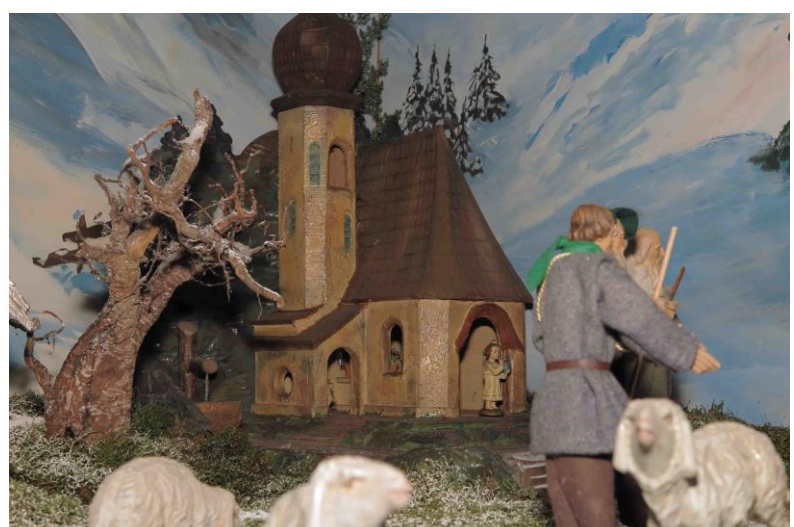
das Kirchlein ist der älteste Teil unserer Weihnachtskrippe