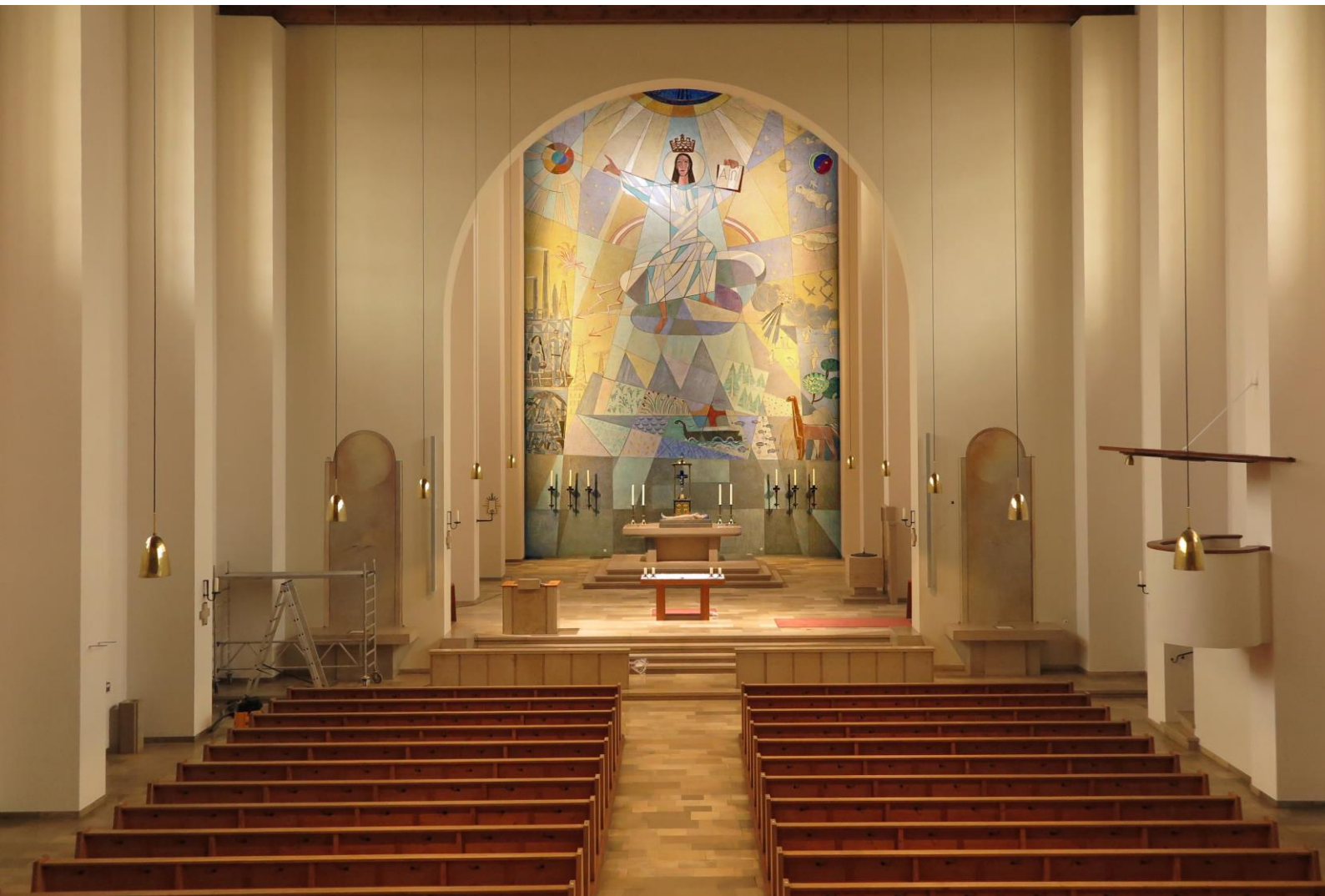
der Kirchenraum erstrahlt in neuer, warmtonig eingestellter Farbgebung