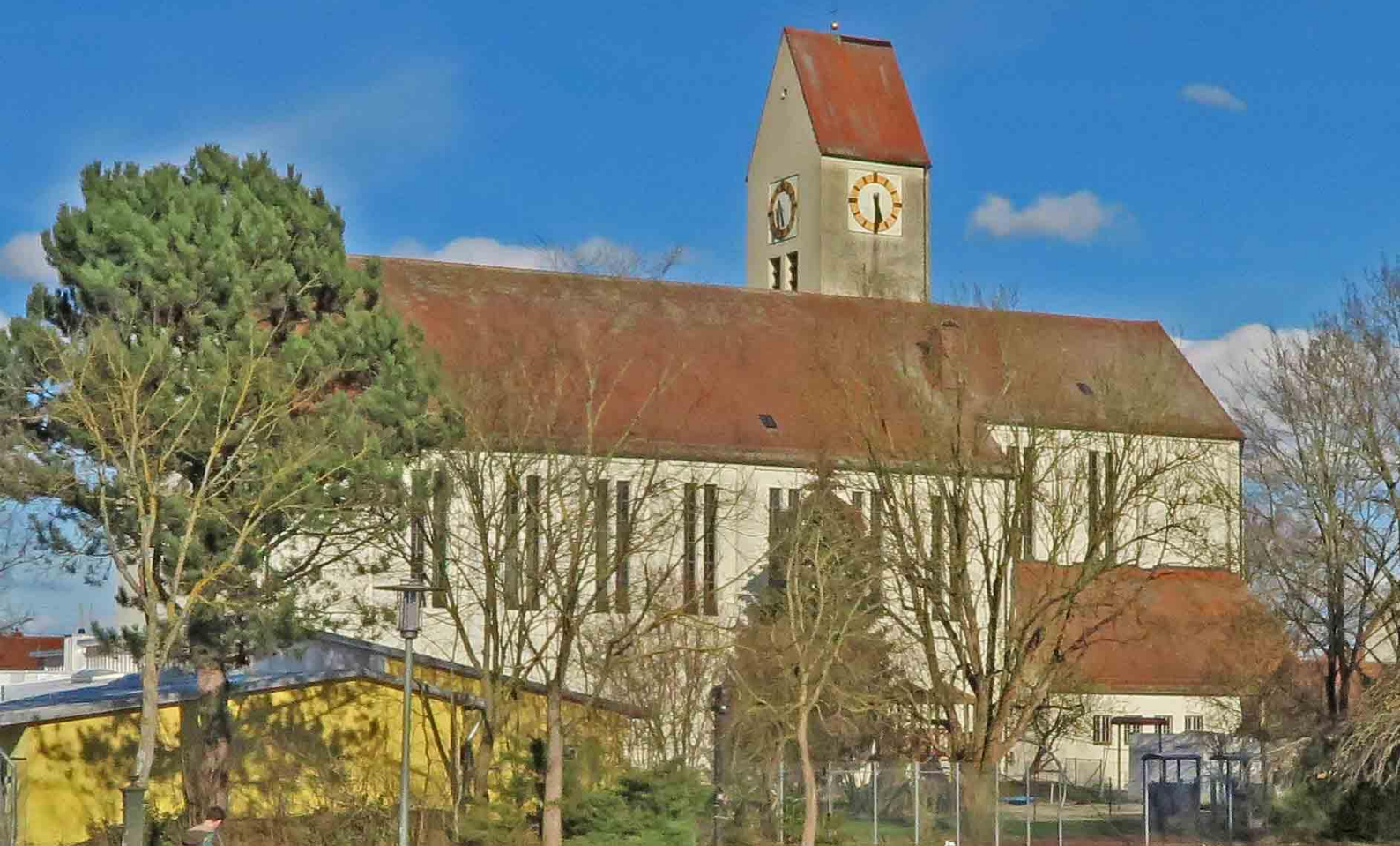
Ansicht unserer Pfarrkirche vor der Generalsanierung