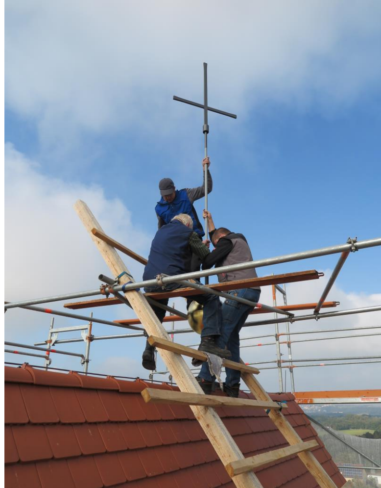
nach ihrer Überholung kommen Turmkreuz und Turmkugel wieder auf den Turmfirst