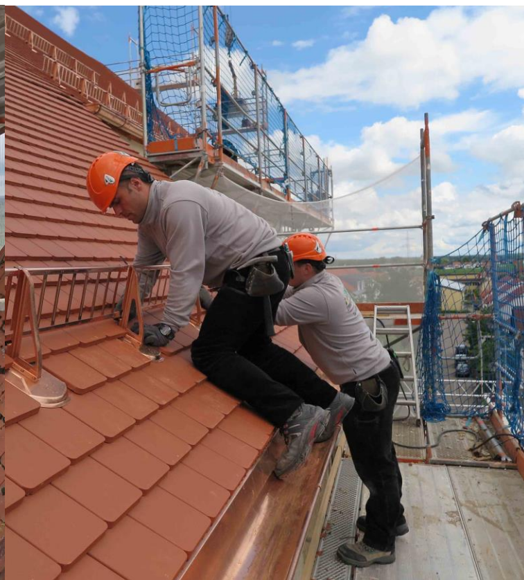
rund 200 Meter Schneefanggitter werden montiert