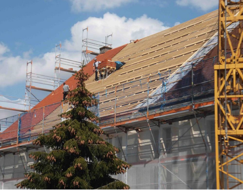
das Dach erhält eine zusätzliche Bretterverschalung und wird mit 51.000 Dachziegeln neu gedeckt