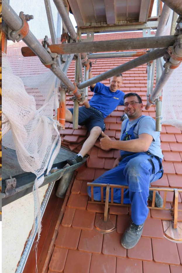
sämtliche Blechverwahrungen, Regenrinnen und -abläufe werden erneuert