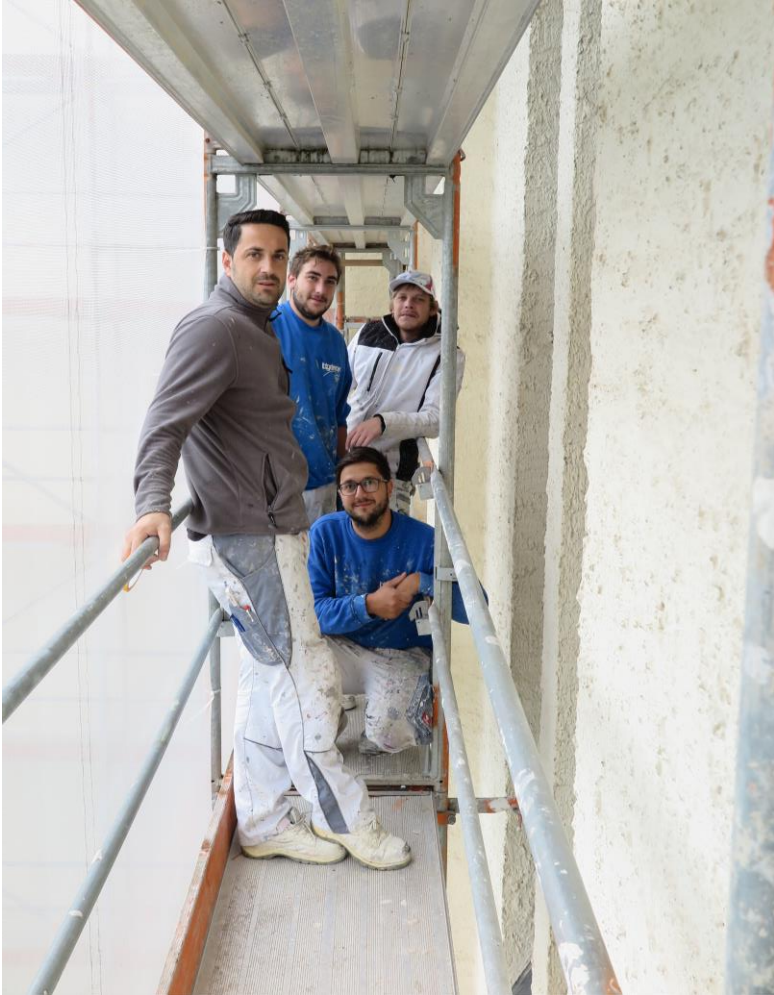
mit über 1.000 ltr. Farbe wird die Fassade dreimal gestrichen